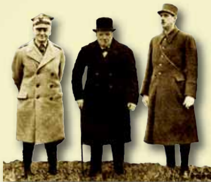
Sikorski, Churchill et De Gaulle

Après l'armistice, la police française en zone non occupée arrête les soldats polonais qui cherchent à rejoindre Londres. Ils les conduisent au camp de Septfonds dans le Tarn-et-Garonne, organisé par la Direction de la Sûreté du Ministère de l'Intérieur pour l'internement des « officiers des armées ex-alliées, ayant tenté de quitter la France clandestinement »