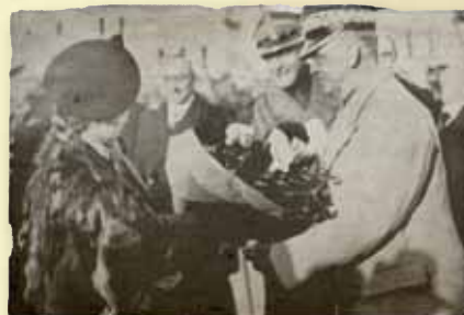
Accueil du Général Sikorski à la gare d'Angers

vernement sont particulièrement menacés par des éléments polonais hostiles, par des groupes terroristes ukrainiens et par des organismes secrets à la solde de l'ennemi. ». Le Préfet de Maine-et-Loire met alors en place un plan de protection comprenant des inspecteurs en civil, des gardes mobiles, le contrôle de la correspondance, la surveillance des résidences et la filature des personnalités polonaises. Cela