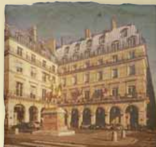
Hôtel Régina - Paris

rités françaises tentent-elles d'éloigner la mauvaise conscience de leur responsabilité dans la « drôle de guerre ».