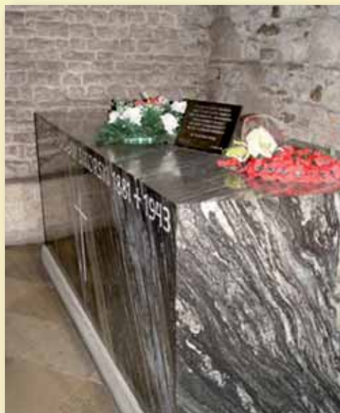
le Général Wladyslaw Sikorski repose dans la crypte des grands polonais, sous la cathédrale de Wawel à Cracovie, le panthéon polonais.

Refusant de reconnaître la Pologne communiste, le gouvernement polonais en exil, à Londres, continua à exister sur le sol britannique jusqu'au 22 décembre 1990. Peu après l'élection de Lech Wałęsa à la présidence de la république Polonaise, il a mis fin à son fonctionnement, remettant au premier président de la Pologne libre les insignes présidentiels qui ont transité par Angers et qui ont séjourné à Londres durant un demi siècle. Ce fut pour de nombreux Polonais la véritable fin de Seconde Guerre mondiale.