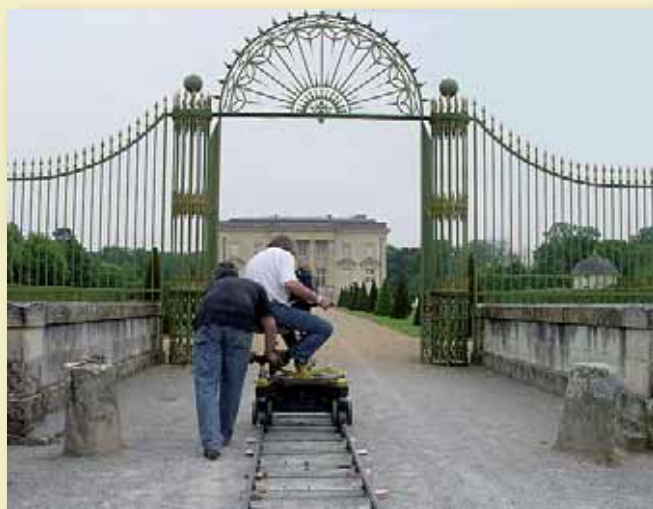
St Barthelemy d'Anjou, château de Pignerolle – 2006 Tournage du documentaire de Grzegorz Tomczak: « Angers, capitale de la Pologne libre » (coproduction : FR3 Ouest / Telewizja Polska SA, 52 min)

Depuis la multiplication des jumelages en Anjou avec des communes polonaises, est créée le 21 janvier 2004 la Fédération Départementale d'échanges franco-polonais réunissant l'association Anjou-Pologne d'Angers, l'association « Amitiés Echanges St Barth-Gabin » de St Barthélémy d'Anjou, l'association « Bécon Echanges Amitiés » de Bécon-les-Granits, le Comité de jumelage de Chalonnes sur Loire, le Comité de Jumelage de l'Ingrandes-sur-Loire.