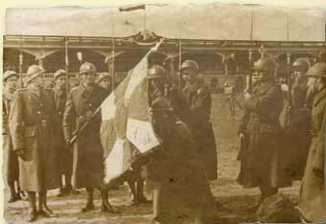
30 mars 1940 - stade Bessonneau à Angers. Serment de la 1 ère Division de Grenadiers (1DG)

Malheureusement Angers est loin des centres de décision du monde libre. La voix de Sikorski restera confidentielle en l'Anjou. Les alliés de la Pologne découvriront plus tard, trop tard, cette triste vérité.