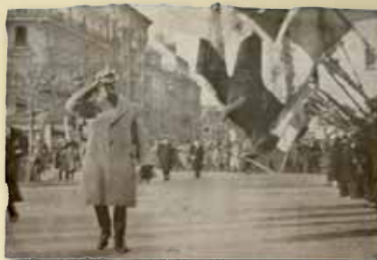
Général Sikorski à Angers le 22/11/1939 (Petit Courrier, janvier 1940)

Au printemps 1940, l'armée polonaise est engagée dans la défense de la France, comptant sur sa capacité de résistance. Le Général Sikorski installe son Etat-major à Nancy pour être en première ligne. L'effectif de l'armée polonaise en France, au mois de juin, est de 80 326 hommes. Les soldats portent l'uniforme français, alors que les cadres sont en tenue militaire polonaise. C'est une armée alliée rattachée au commandement français et prête à combattre. Mais la bataille de France était perdue, avant d'être terminée. Pourtant en 1940, l'armée française était considérée comme une des meilleures au monde.