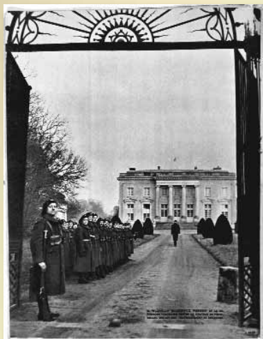
Gouvernement polonais au château de Pignerolle (Maine-et-Loire) : M. Raczkieviev président de la République et le général Sikorski, président du Conseil. 2 décembre 1939.

La revue Match, du 28 décembre 1939 publie un long reportage sur Angers avec le commentaire suivant : « Angers, ville paisible de la province française, est devenue la capitale de l'État polonais... »