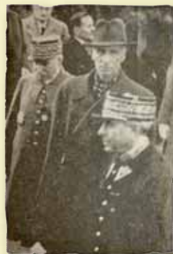
Président Raczkiewicz avec les autorités françaises

A Sainte-Gemmes-sur-Loire stationne un détachement de 892 hommes dont 60 sous-officiers et une compagnie d'instruction de 183 hommes.