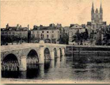
Vue d'Angers avant 1939

entraînera une protestation polonaise mais sans conséquence.