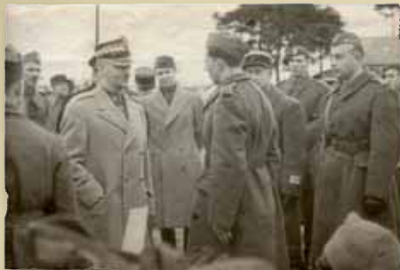
Général Sikorski en inspection dans un camp militaire polonais

A partir d'Angers, le général Sikorski, reconstitue l'Armée polonaise. Les autorités françaises ont mis à sa disposition le camp militaire de Coëtquidan, dans le Morbihan, fonctionnant dès le mois de septembre 1939.