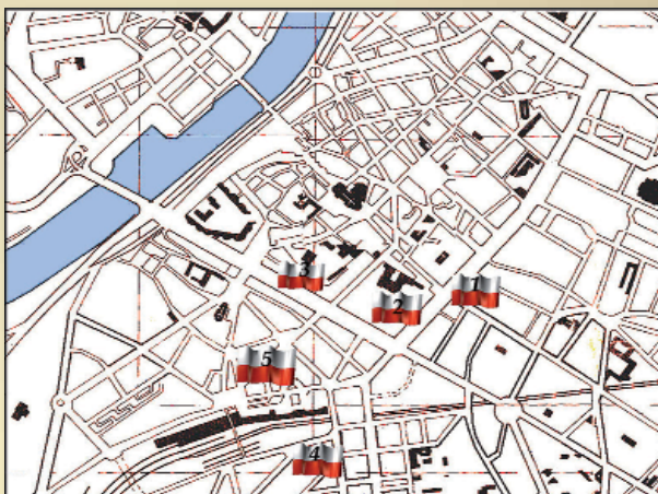
Institutions polonaises dans le centre d'Angers en 1939

Il y a aussi une partie du trésor de la Banque polonaise. Les premiers jours du mois de septembre, les Polonais font passer par la Roumanie 74 tonnes d'or et 100 tonnes de valeurs, billets de banque et entre autre des tapisseries (arasy) du château de Wawel de Cracovie. Passant par Beyrouth, Marseille et Toulon, une partie du trésor est déposée à la Banque de France à Nevers et à Angers.