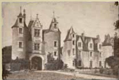
Château de la Coltrie

Le général Sosnkowski, ministre de l'intérieur et organisateur de la résistance polonaise, est logé au château de Molières, à Beaucouzé.